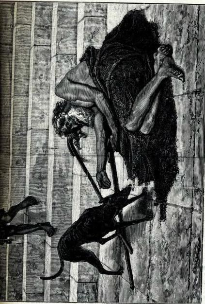
БОГАТЫЙ И ЛАЗАРЬ.