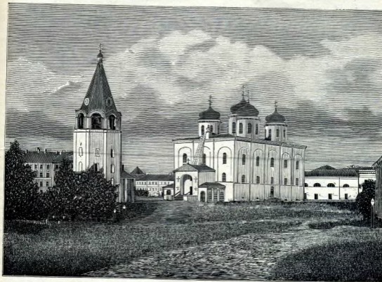
Нижегородскій Преображенскій Соборъ.

Первый томъ повѣствованій Барскаго періодъ съ 1723 по 1727 годъ, т. е. первое его странствованіе. Намъ уже извѣстно, года Барскій, по оставленіи имъ Кіева, по Грецію, Аеонъ, и въ которые Архиепископскіе шлѣхъ первое путешествіе въ Палестину и до конца 1727 года отправился на поклоненіе Александрійскаго патриархата. Такимъ образомъ томъ описываетъ свой путь отъ Кіева до пребыванія въ этомъ послѣднемъ городѣ, заглавствія, которыя побудили его предпринять странстванія въ Варъ и Римъ. Описавъ обстоя-