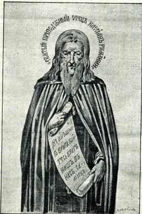
Св. Кассіанъ Римлянинъ.

Св. Кассіанъ родился въ Римѣ между 350 и 360 годами и происходилъ отъ знатныхъ и богатыхъ родителей. Онъ получалъ прекрасное по тогдашнему времени образованіе, но душа его съ юношескихъ лѣтъ стремилась къ богоуд-